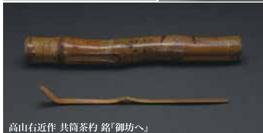
高山右近作 共筒茶杓 銘「御坊へ」