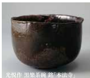
光悦作 黒樂茶碗 銘「本法寺」