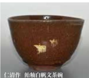
仁清作 飴釉白帆文茶碗