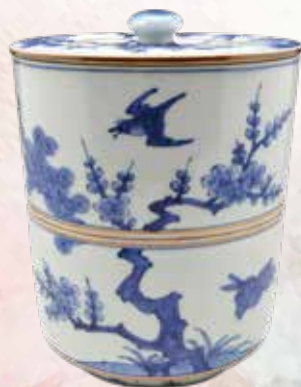
仁阿弥道八作 祥瑞写松竹梅文水指

古来より日本人に愛されてきた、春の到来を祝う風習「花見」。その象徴となる梅と桜は、茶道具にも文様や形容として表現され、また銘としても多く用いられてきました。本春季展では、吉郎兵衛コレクションの中から『梅と桜』にちなんだ、茶道具を中心に、人形や玩具などもご紹介致します。ぜひこの機会に日本人の春に対する美意識を感じていただければ幸いです。第二展示室では嵯峨・木目込人形などの中から雛人形を展示致します。併せてご覧ください。