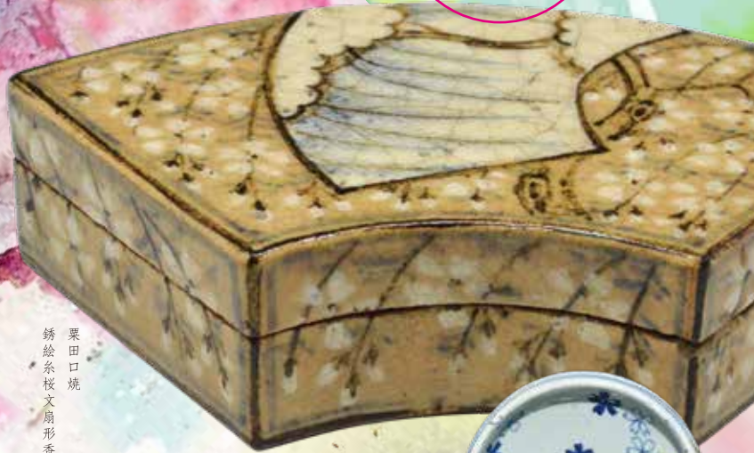
粟田口焼 錆絵糸桜文扇形香合