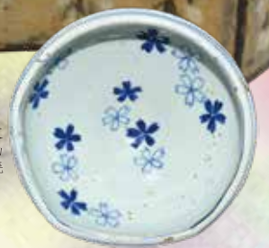
東山焼 染付桜川写水指