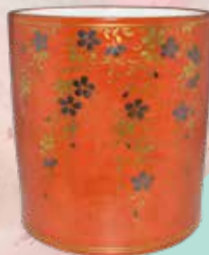
九谷焼 金襴手糸桜文水指